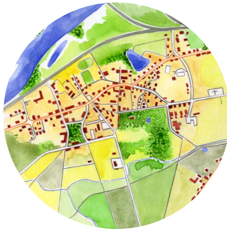
Parc de la sauvagerie

Commune urbaine de 3214 habitants, bordée par la Seine, Varennes tient son nom soit du vocable mérovingien "varinna" signifiant eau, soit de l'allemand "garde défense".