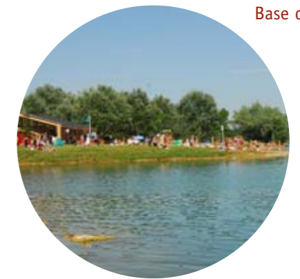
Base de loisirs

Du petit château de la Sauvagerie, seuls restent le parc et l'orangerie, bâtiment très en vogue au XIX e . Aujourd'hui, ce bâtiment accueille le centre socioculturel, avec la bibliothèque municipale et des salles associatives.