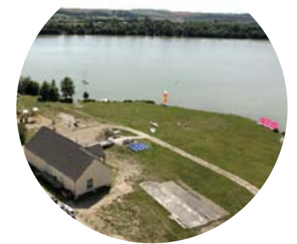
Base de loisirs

La commune, lieu de résidence recherché, a acquis un magnifique plan d'eau de 51 hectares, avec une des meilleures expositions au vent d'Île-de-France. Elle y a aménagé une base de loisirs ouverte toute l'année, axée sur les activités nautique comme la planche à voile ou la pêche, mais aussi le VTT et la randonnée sur des circuits balisés.