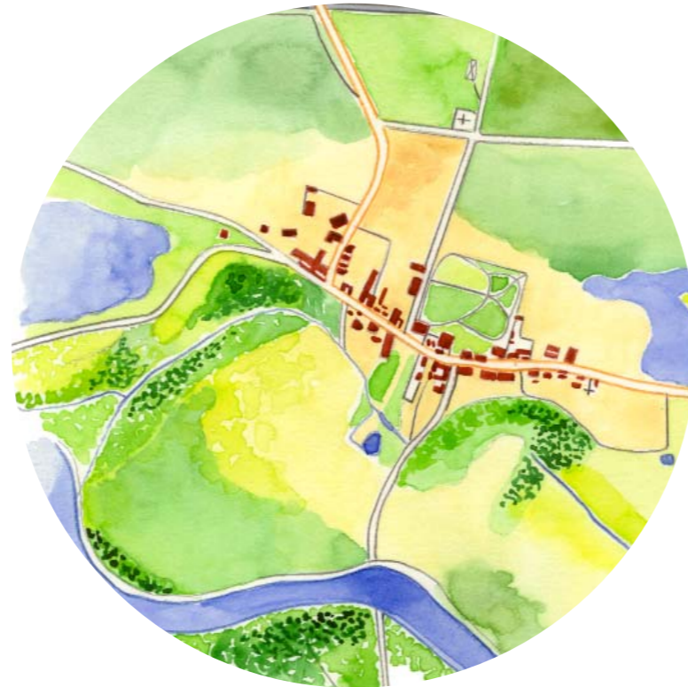
L'Eglise de l'Assomption (XIV e siècle)

Quelques 151 Barbésiens habitent ce petit village dont le nom vient soit du latin "Barbitus", qui signifie la harpe – allusion à la forme prise par la Seine et l'Yonne avant de confondre leurs eaux – soit de "barbeau", poisson commun dans l'Yonne.